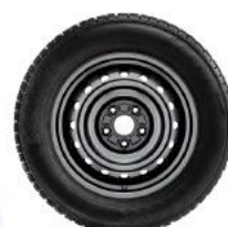
Jantă din otel C-HR 17"

NOTA: Preturile de lista reprezinta preturi de vanzare recomandate. Preturile in lei se vor calcula la cursul BNR + 0,5% valabil in ziua platii. Preturile afisate includ Pachetul legislativ obligatoriu (trusa medicala, triunghi reflectorizant, extincător). Lista de dotari constituie o selectie a celor mai importante dintre acestea. Afisaj indisponibil in limba romana. Toyota Romania isi rezerva dreptul de a modifica prezenta lista de preturi ca urmare a unor erori, modificari structurale sau in urma unor comunicari din partea producatorului, fara nicio informare prealabila. Pentru a obtine o oferta de actualitate, este necesar sa va adresati unui consultant de vanzari Toyota. Garantia pentru autovehiculele Toyota: 6 ani sau 200.000 km in functie de primul termen atins.