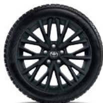
10 spite duble, neagră