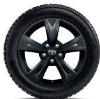
5 spite, neagră