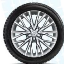
10 spite duble, argintie