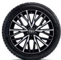
10 spite duble, aspect forjat