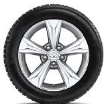
5 spite, argintie