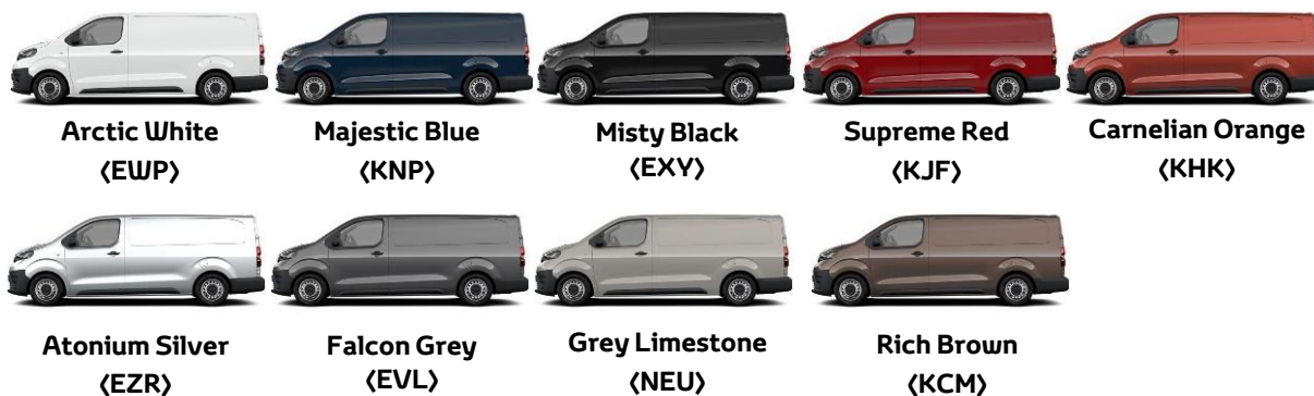
Arctic White (EWP)

* Culoare nemetalizată 1 in limita stocului disponibil nemetalizată 2 culoare restrictionata temporar