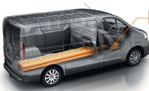
Incarcare obiecte lungi de pana la 4 m