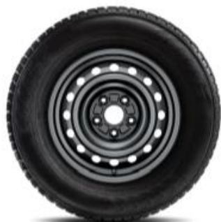
Jantă din oțel ProAce 16"

NOTA: Preturile de lista reprezinta preturi de vanzare recomandate. Preturile in lei se vor calcula la cursul BNR + 0,5% valabil in ziua platii. Preturile afisate includ Pachetul legislativ obligatoriu (trusa medicala, triunghi reflectorizant, extingtor). Lista de dotari constituie o selectie a celor mai importante dintre acestea. Afisaj indisponibil in limba romana.