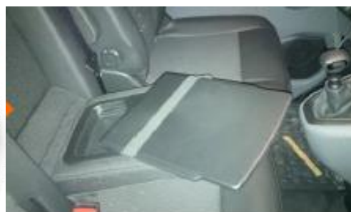
Birou mobil pentru laptop sau documente