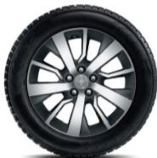
5 spite duble, aspect forjat