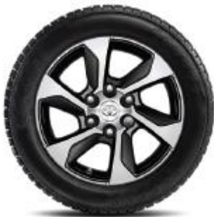
6 spite, aspect forjat

NOTA: Preturile de lista reprezinta preturi de vanzare recomandate. Preturile in lei se vor calcula la cursul BNR + 0,5% valabil in ziua platii. Preturile afisate includ Pachetul legislativ obligatoriu (trusa medicala, triunghi reflectorizant, extingtor). Lista de dotari constituie o selectie a celor mai importante dintre acestea. Afisaj indisponibil in limba romana.