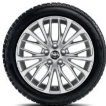
10 spite duble, argintie