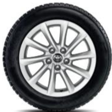
9 spite, argintie