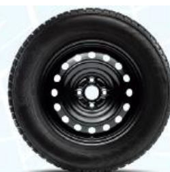
Jantă din oțel Aygo 15"

NOTA: Preturile de listă reprezintă preturi de vânzare recomandate. Preturile în lei se vor calcula la cursul BNR + 0,5% valabil în ziua plății. Preturile afișate includ Pachetul legislativ obligatoriu (trusa medicală, triunghi reflectorizant, extingtor). Lista de dotări constituie o selecție a celor mai importante dintre acestea. Afișaj indisponibil în limba română.