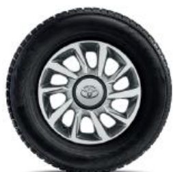
10 spițe, argintie