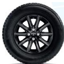
10 spițe, neagră