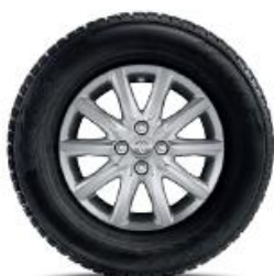
10 spițe, argintie